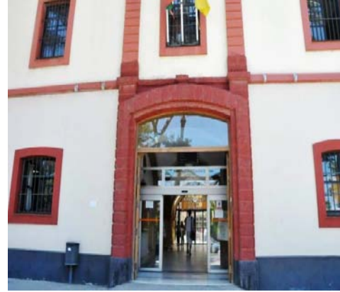
Fachada principal de la Facultad de Filosofía y Letras