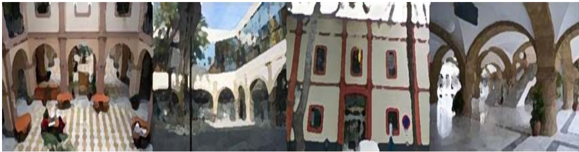
Facultad de Filosofía y Letras (Avenida Gómez Ulla, Cádiz)